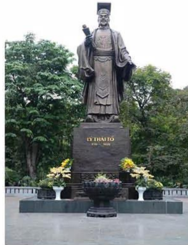
Hình 2.1. Tượng vua Lý Thái Tổ (Hoàn Kiếm, Hà Nội)

Căn cứ vào thông tin nào trong đoạn trích trên để biết được sự kiện này đã diễn ra trong lịch sử?