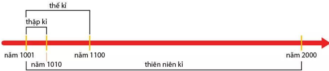
Hình 2.4. Sơ đồ biểu diễn các đơn vị tính thời gian: thập kỉ, thế kỉ, thiên niên kỉ