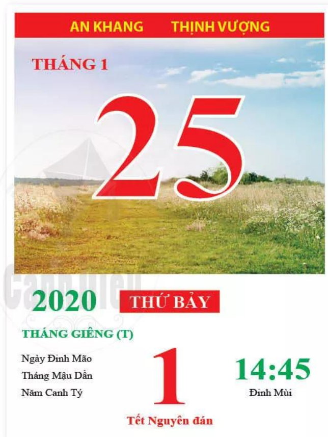
Hình 2.2. Tờ lịch của Việt Nam sử dụng âm lịch và dương lịch

Ngày nay, để thuận tiện trong việc giao lưu, trao đổi, đa số các quốc gia đều thống nhất sử dụng Công lịch (dương lịch). Công lịch lấy năm tương truyền Chúa Giê-su (người sáng lập đạo Ki-tô) ra đời là năm đầu tiên của Công nguyên.