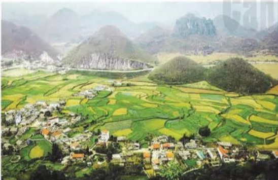
Hình 3.1. Quang cảnh Núi Đồi ở huyện Quán Bạ, tỉnh Hà Giang, Việt Nam

Chúng ta có thể diễn tả cảm nhận của mình về địa phương, về cộng đồng xung quanh bằng cách miêu tả bằng lời, vẽ một bức phác hoạ khung cảnh, vẽ một sơ đồ về các địa điểm mình yêu thích, về các nơi ở của họ hàng, bạn bè tại địa phương,... Một phương tiện đặc biệt để mô tả hiểu biết của cá nhân về một địa phương là lược đồ trí nhớ .