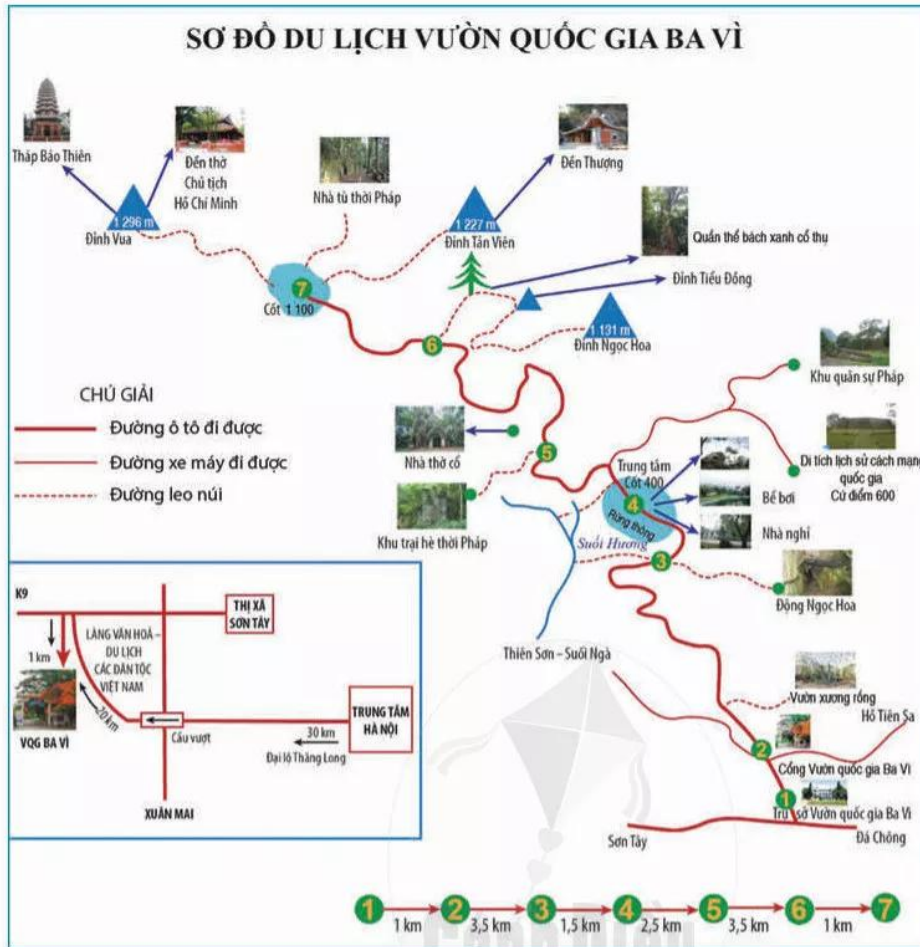
Hình 3.5. Sơ đồ du lịch Vườn quốc gia Ba Vì (Hà Nội, Việt Nam)

? Quan sát hình 3.5, hãy lựa chọn các địa điểm danh thắng mà em muốn đến và tạo ra một lược đồ trí nhớ để đi từ trụ sở Vườn quốc gia Ba Vì đến những địa điểm danh thắng đã chọn.