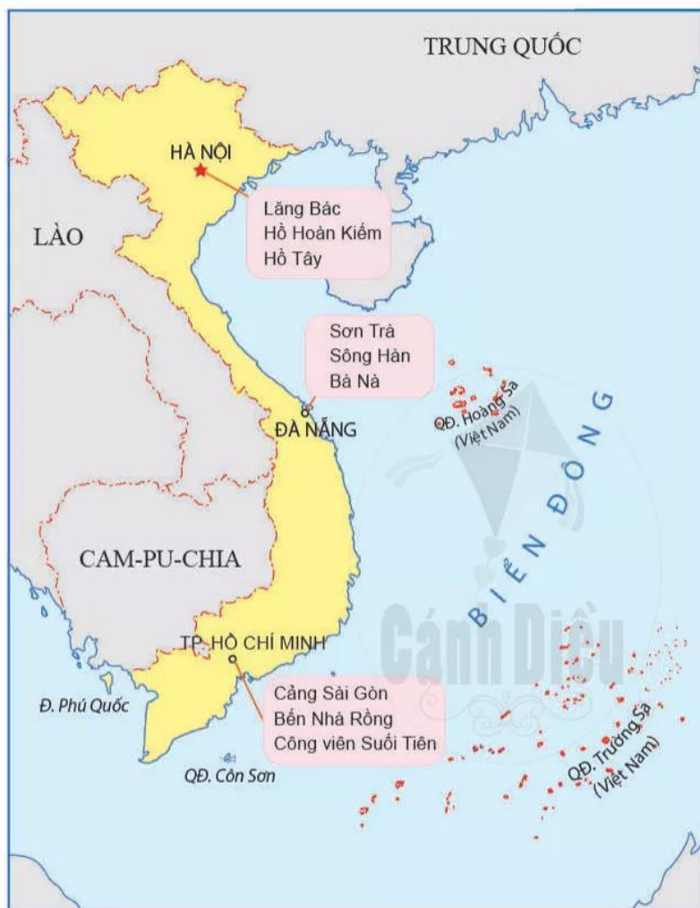
Hình 3.3. Minh họa một lược đồ trí nhớ liên quan đến Hà Nội, Đà Nẵng và Thành phố Hồ Chí Minh

Khi học về địa lí thế giới hay địa lí Việt Nam, những tri thức về không gian và sự phân bố của các đối tượng địa lí, một số thuộc tính của chúng, được lưu giữ trong trí nhớ của cá nhân dưới dạng lược đồ trí nhớ. Trong những tình huống nào đó, người này sẽ nhớ lại các thông tin và vẽ chúng trên giấy.