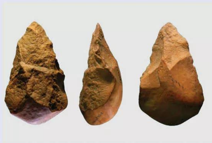
Hình 3.6. Rìu đá An Khê (Việt Nam, khoảng 800 000 năm trước)