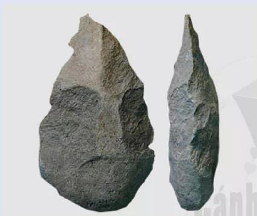
Hình 3.5. Rìu đá A-sơ-lin (Pháp, khoảng 1,8 triệu năm trước)