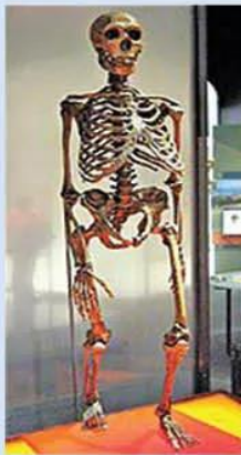
Hình 3.2. Bộ xương phục chế "Người Nê-an-đéc-tan"

Năm 1856, tại thung lũng Nê-an-đéc-tan (Đức), một giáo viên địa phương tìm thấy trong đồng đất sét một số mẫu xương và cho rằng đó là xương của người cổ hoá thạch. Ba mươi năm sau, các nhà khảo cổ học mới chứng minh đây là hoá thạch của người nguyên thủy có niên đại khoảng 100 000 năm trước và đặt tên là "Người Nê-an-đéc-tan".