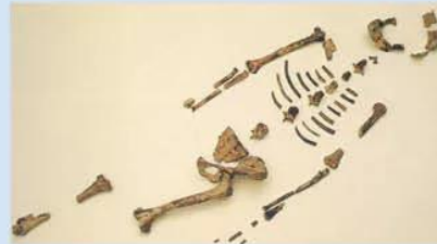
Hình 3.3. Bộ xương hoá thạch "Cô gái Lu-cy"

Năm 1856, tại thung lũng Nê-an-đéc-tan (Đức), một giáo viên địa phương tìm thấy trong đồng đất sét một số mẫu xương và cho rằng đó là xương của người cổ hoá thạch. Ba mươi năm sau, các nhà khảo cổ học mới chứng minh đây là hoá thạch của người nguyên thủy có niên đại khoảng 100 000 năm trước và đặt tên là "Người Nê-an-đéc-tan".