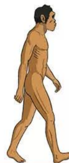
Người tinh khôn