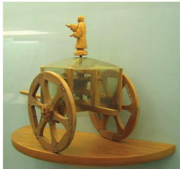
Hình 8.10. Xe chỉ nam

Người Trung Quốc đã đặt nền tảng cho các phát minh quan trọng về kĩ thuật, như làm giấy, la bàn, kĩ thuật in,... trong đó có những phát minh vẫn còn được sử dụng đến ngày nay.