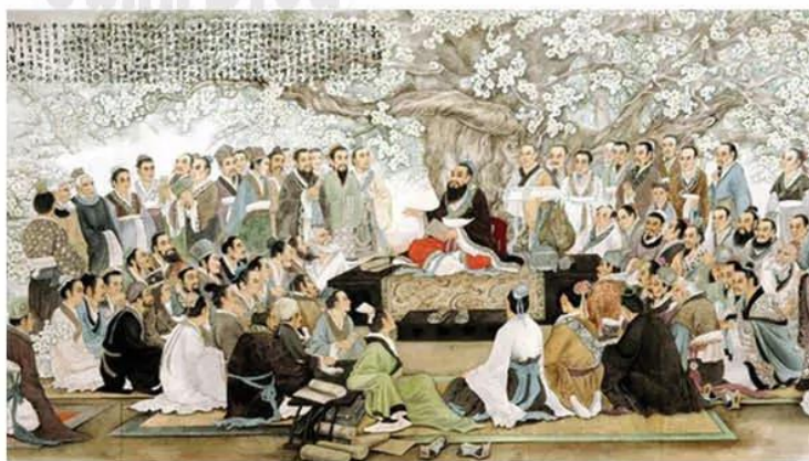
Hình 8.7. Khổng Tử và các học trò (tranh minh họa)

Đạo gia: đại diện là Lão Tử, mong muốn xã hội phát triển theo tự nhiên, không tranh giành của cải hay quyền lực.