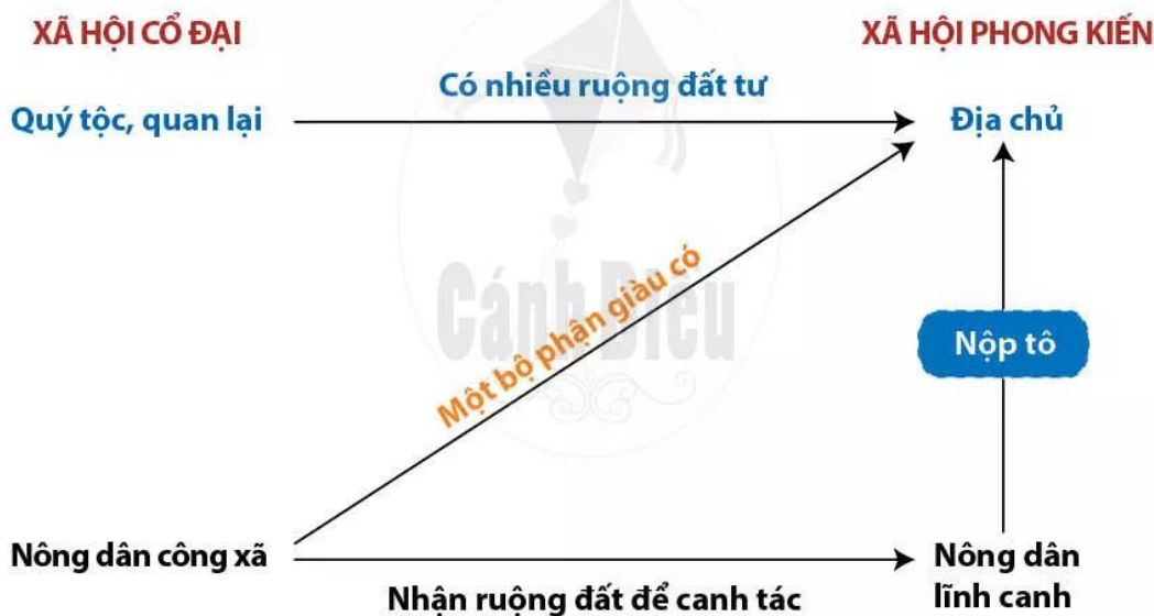
Hình 8.5. Sơ đồ quá trình hình thành xã hội phong kiến ở Trung Quốc dưới thời Tần Thủy Hoàng

Dưới thời nhà Tần, xã hội Trung Quốc có nhiều thay đổi.