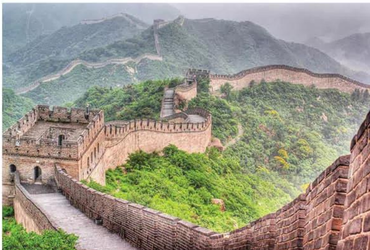
Hình 8.11. Vạn Lí Trường Thành

Vạn Lí Trường Thành được người Trung Quốc xây dựng nhằm ngăn chặn các cuộc tấn công từ bên ngoài. Đây được xem là biểu tượng của nền văn minh Trung Quốc.