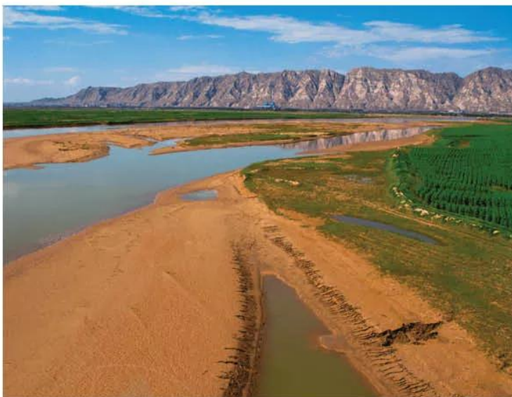
Hình 8.2. Một đoạn Hoàng Hà

Với những điều kiện tự nhiên thuận lợi, từ rất sớm, những nhà nước cổ đại đầu tiên đã ra đời ở hạ lưu Hoàng Hà, tiếp đó là ở hạ lưu Trường Giang.