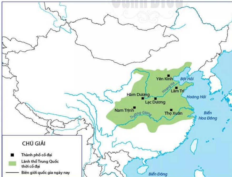
Hình 8.1. Lược đồ Trung Quốc cổ đại

Vào thời cổ đại, lãnh thổ Trung Quốc nhỏ hơn ngày nay, cư dân tập trung chủ yếu ở lưu vực hai con sông lớn là Hoàng Hà và Trường Giang (còn gọi là Dương Tử).