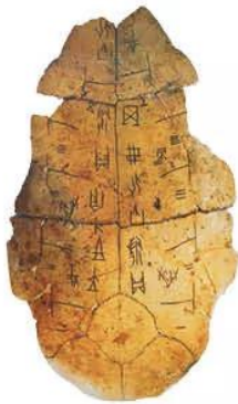
Hình 8.8. Chữ giáp cốt (khắc trên mai rùa)