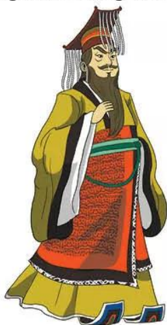
Hình 8.4. Tần Thủy Hoàng (tranh vẽ)

Nửa sau thế kỉ III TCN, nước Tần mạnh lên, lần lượt đánh bại các nước khác và thống nhất Trung Quốc vào năm 221 TCN.