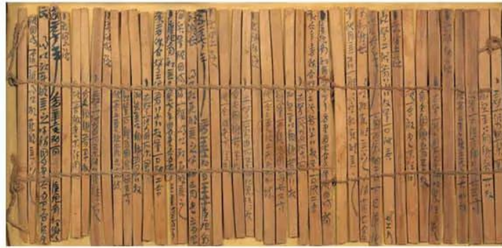
Hình 8.9. Chữ viết trên thẻ tre, gỗ