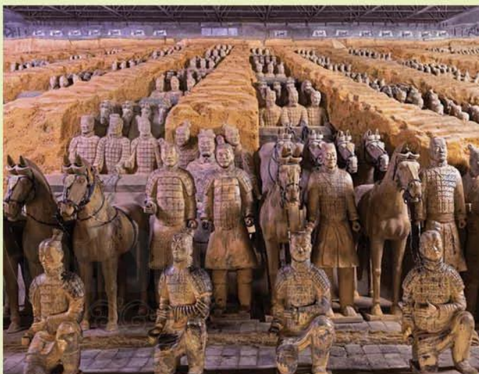
Hình 8.12. Đội quân bằng đất nung được tìm thấy tại lăng mộ Tần Thủy Hoàng

Tại đây, các nhà khoa học đã tìm thấy hàng nghìn tượng chiến binh và tượng con vật bằng đất nung thuộc các loài khác nhau.