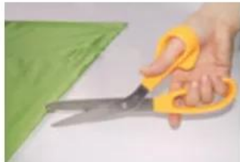
Hình 3. Cách cầm kéo