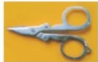
b) Kéo cắt chỉ