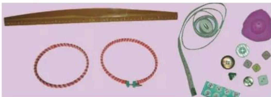
Hình 6. Một số vật liệu và dụng cụ khác