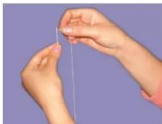
Hình 5 a) Khâu chỉ vào lỗ kim