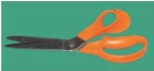
a) Kéo cắt vải

Kéo cắt vải có hai bộ phận chính là lưỡi kéo và tay cầm. Giữa tay cầm và lưỡi kéo có chốt (hoặc vít) để bắt chéo hai lưỡi kéo.