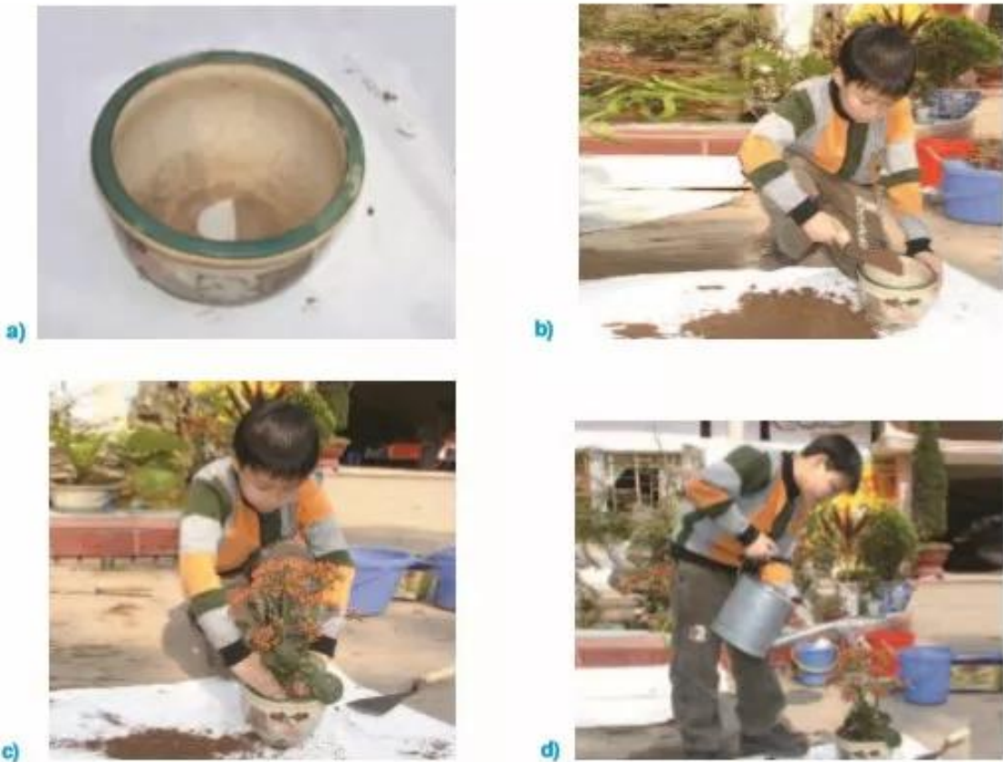
Hình 3. Trồng cây trong chậu

(?) Tại sao phải tưới nhẹ nước quanh gốc cây mới được trồng ?