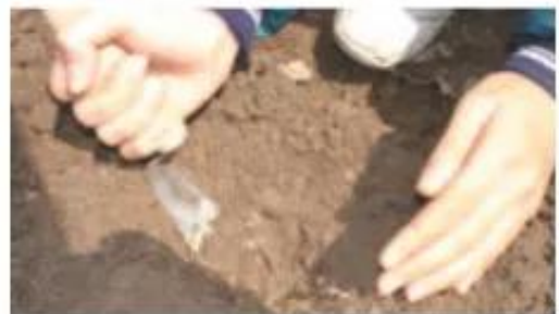
b) Đào hốc