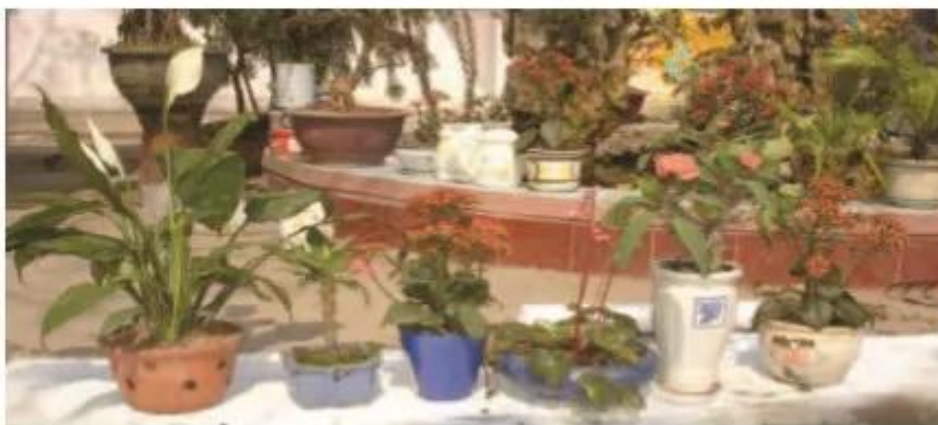
Hình 1. Một số loại chậu trồng cây