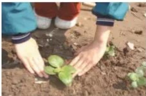
c) Trồng cây