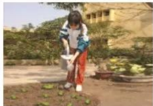
d) Tưới nước