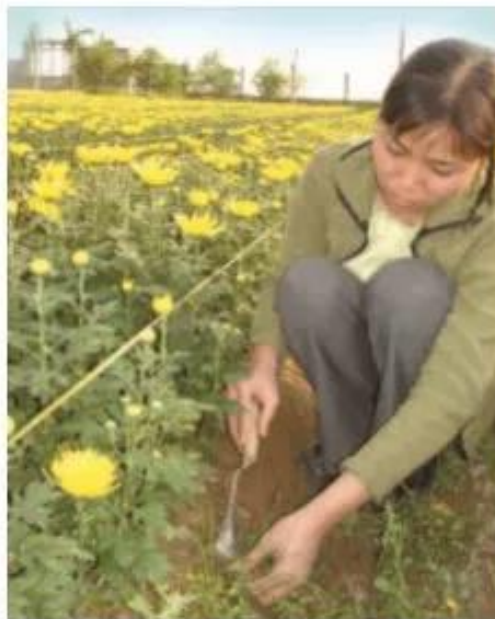
Hình 3. Làm cỏ

❓ Tại sao phải chọn những ngày nắng để làm cỏ ?