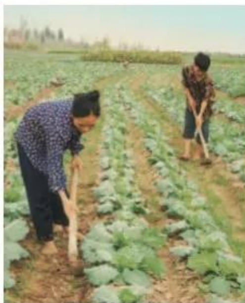
Hình 4. Vun xới đất

❓ Vun đất quanh gốc cây có tác dụng gì ?