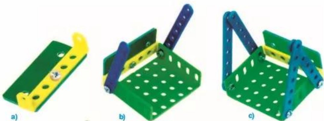
Hình 3. Lắp ghế đu

- Lắp tay cầm và thành sau ghế đu vào tấm nhỏ (H.3b) : Lắp 2 thanh thẳng 7 lỗ vào thành sau của ghế đu và tấm nhỏ.