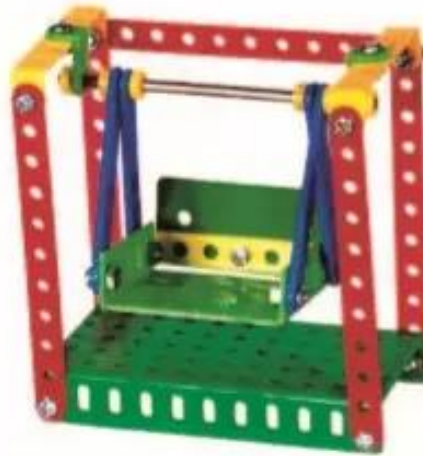
Hình 1. Cái đu