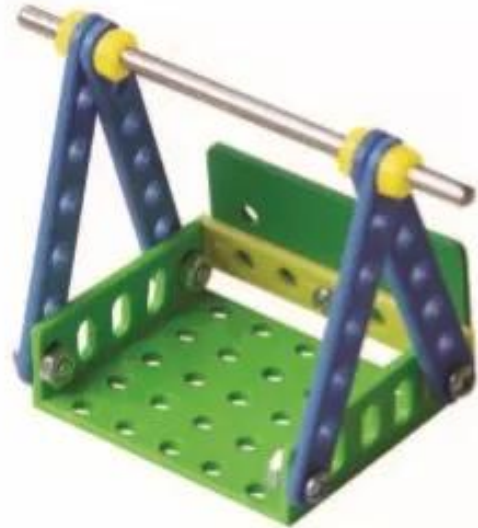
Hình 4. Lắp trực đu

❓ Để cố định trực đu, người ta phải lắp ở mỗi bên tay cầm mấy vòng hãm ?