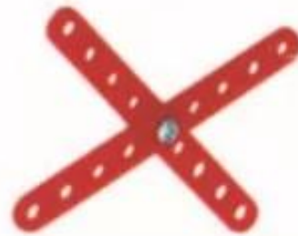
Hình 3. Giá đỡ trục bánh xe