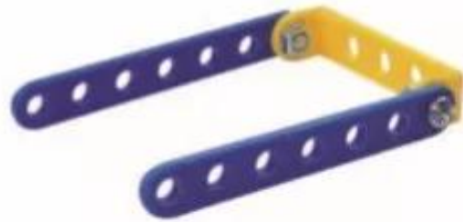
Hình 2. Tay kéo xe