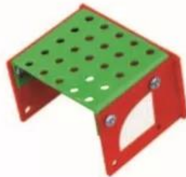
Hình 5. Thành xe và mũi xe