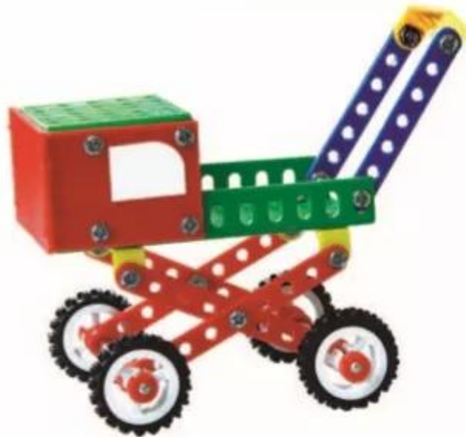
Hình 1. Xe nôi