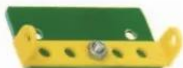
Hình 4. Thành sau thùng xe

❓ Dựa vào hình 4 và hình 5, em hãy tự lắp hai bộ phận này.