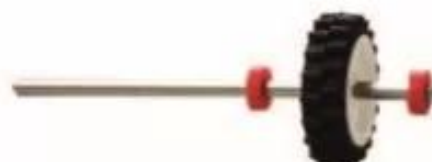
Hình 5. Trục bánh xe