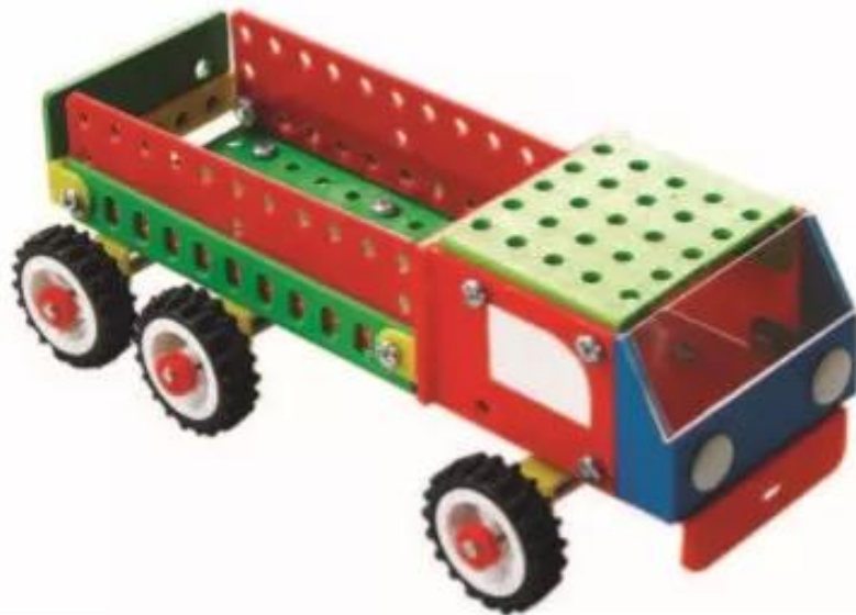
Hình 1. Ô tô tài