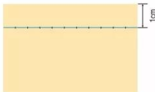
Hình 1. Vạch dấu đường khâu

Vạch dấu đường khâu trên mặt trái của mảnh vải thứ nhất. Có thể chấm các điểm cách đều nhau từ 4mm - 5mm trên đường vạch dấu để khâu cho đều.