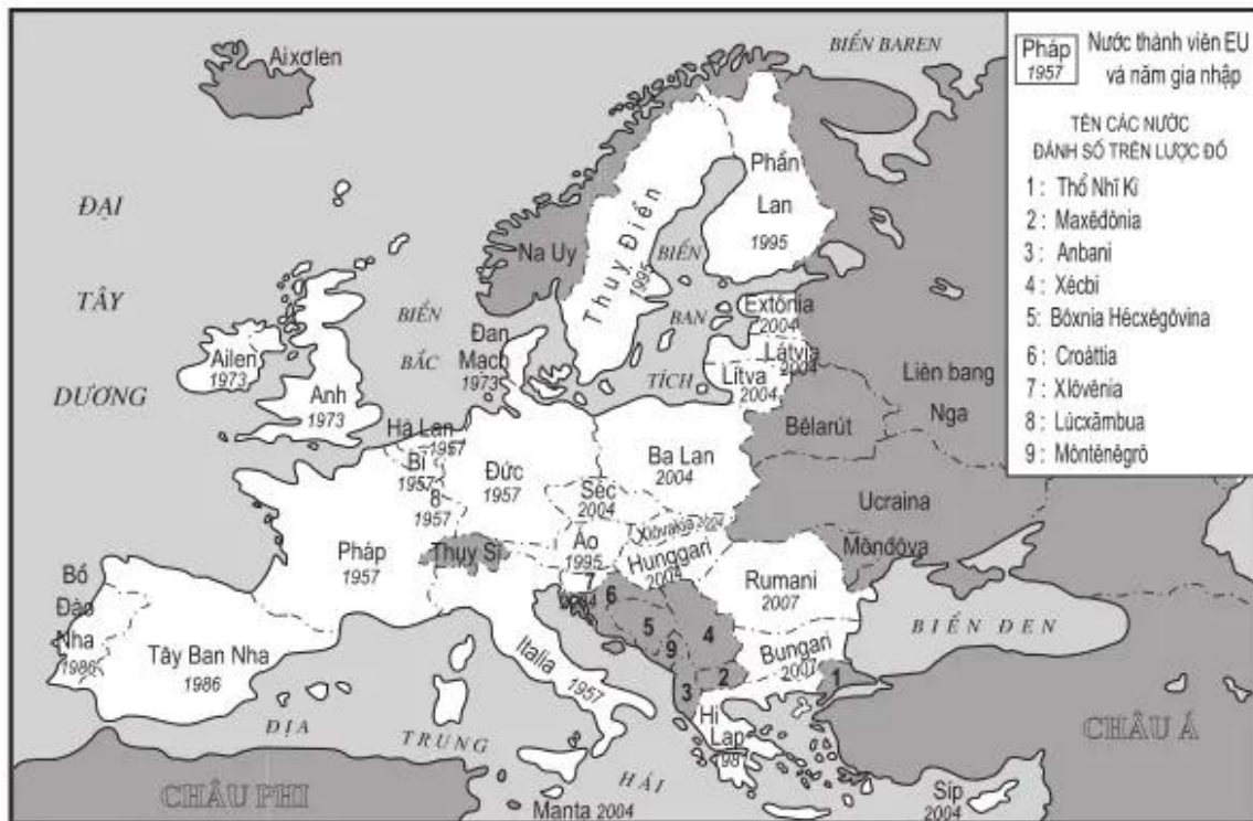
Lược đồ Liên minh châu Âu (EU 27)

1. Tô màu các nước thuộc EU 27 vào hình dưới đây :