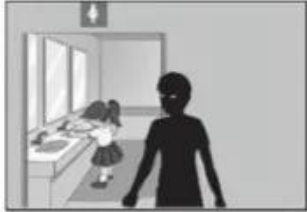
Đi nơi tối tăm, vắng vẻ một mình

3. Tô màu xanh vào việc nên làm và tô màu đỏ vào việc không nên làm.