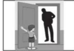
Ở trong phòng kín một mình với người lạ