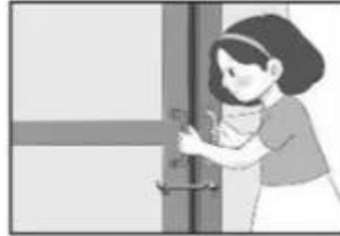
Khóa cửa khi ở nhà một mình