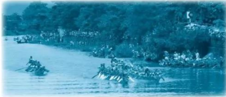
Lễ hội đua thuyền trên sông Kiến Giang, tỉnh Quảng Bình.