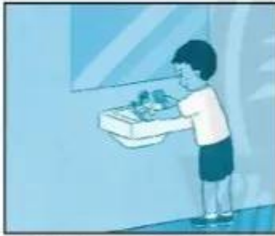
Rửa tay đúng cách