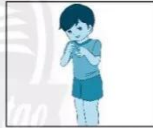
Tự cắt móng tay, chân