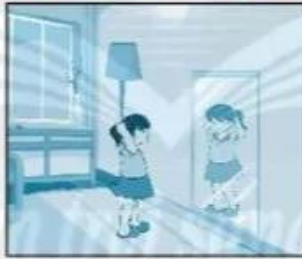
Chải và kẹp tóc gọn gàng