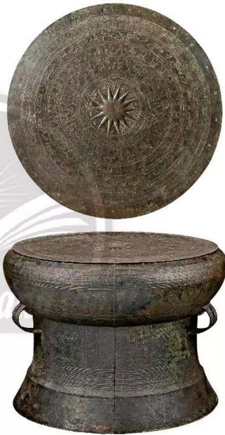
Ảnh: Trống đồng Ngọc Lũ, LSb.5722, Bảo tàng Lịch sử Quốc gia Việt Nam

Hình vẽ trên trống đồng được thể hiện đơn giản, chất lộc, mang tính cách điệu bằng những đường kí hà (nét thẳng và nét cong,...). Đối tượng thể hiện thường là các hoạt động của con người (hình người gặt gạo, chèo thuyền, thổi khèn, vũ nữ, chiến binh) hay chim, thú, nhà, sóng nước,... phản ánh cuộc sống lao động, tín ngưỡng và vui chơi của các cư dân thời Hùng Vương.