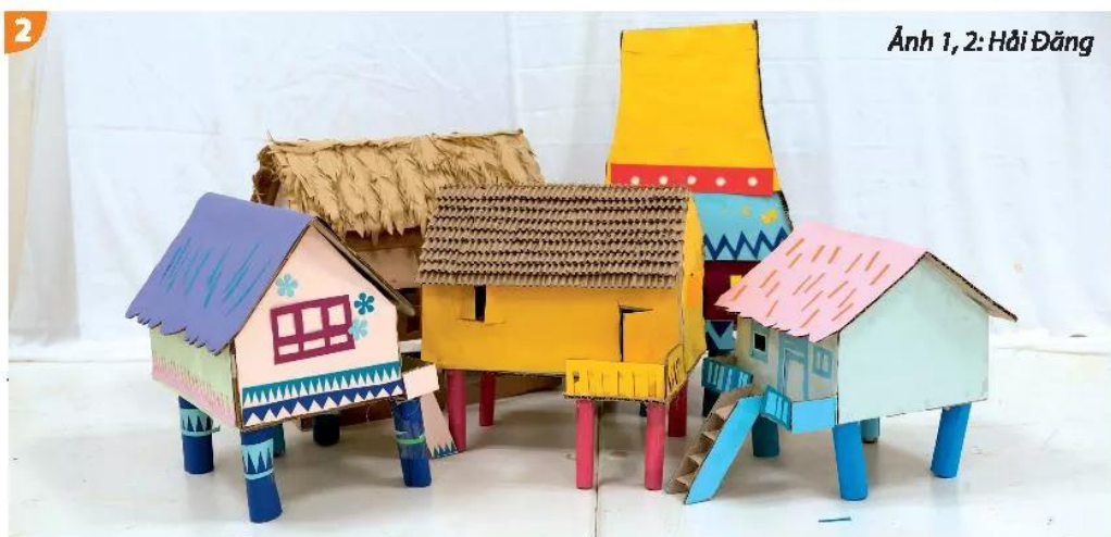
Ảnh 1, 2: Hải Đăng