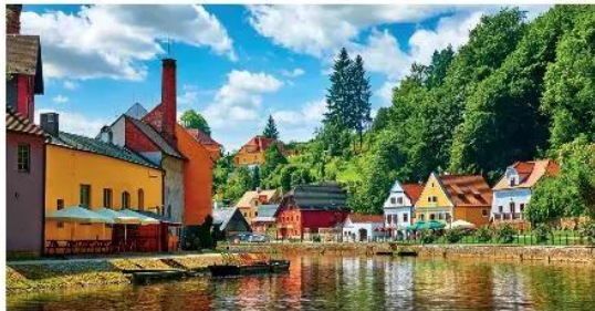
1. Khu nhà ở Cộng hoà Séc