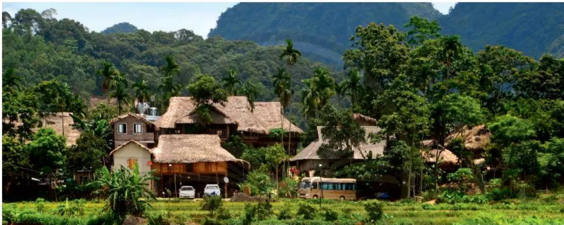
3. Khu nhà ở Thanh Hoá, Việt Nam