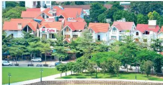
2. Khu nhà ở Hà Nội, Việt Nam